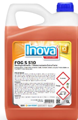
IMAGEM DE PRODUTO

Sendo um produto extremamente corrosivo, é importante ler com atenção todas as precauções e instruções de uso antes de usar o produto. Usar luvas de proteção/vestuário de proteção/proteção ocular/proteção facial.