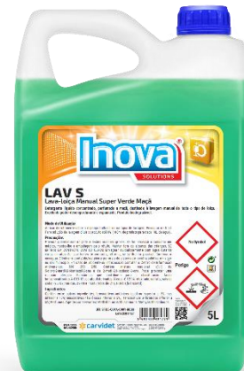
IMAGEM DE PRODUTO

Atenção: Não é adequado o seu uso em máquinas de lavar loiça.