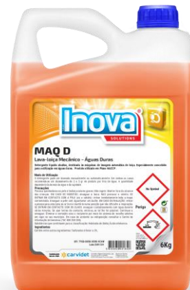
IMAGEM DE PRODUTO

Verificar sempre as instruções do fabricante da máquina de lavar loiça.