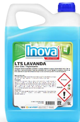
IMAGEM DE PRODUTO

A madeira não tratada não é uma superfície lavável. Em superfícies delicadas aplicar sempre diluído.