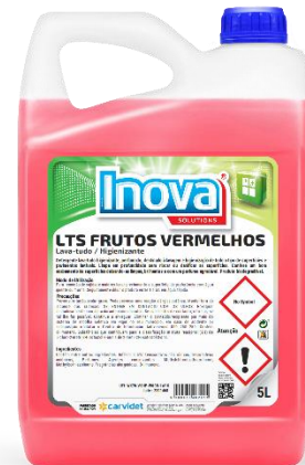
IMAGEM DE PRODUTO