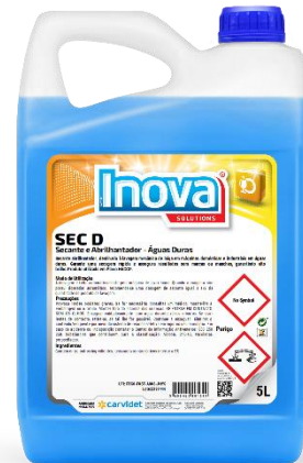
IMAGEM DE PRODUTO

A dosagem é feita automaticamente pela máquina de lavar loiça. Quando a máquina não possui doseador automático, recomenda-se uma dosagem de secante igual a 1/3 da quantidade de produto de lavagem. Pode variar entre 3 a 5 gr por litro de água. A água de enxaguamento deve estar a 70-90°C.